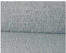
+ Ambiance intérieure : Drake