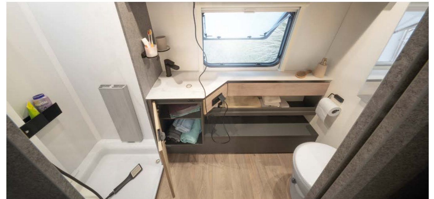
De badkamer die iedereen wil! Bewegingsvrijheid, een aparte douchecabine, een stijlvolle verzonken wastafel en een raam voor de nodige ventilatie! Beter kun je de dag niet starten! • 690 BQT