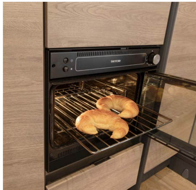
Of het nu gaat om zondagse broodjes, cake of pizza – in de standaard aanwezige oven kunnen diverse vakantielekkernijen bereid worden.