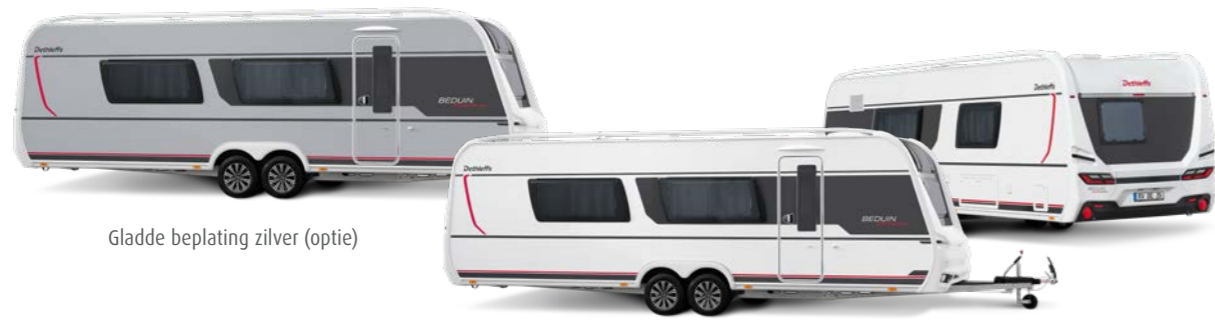
Gladde beplating zilver (optie)