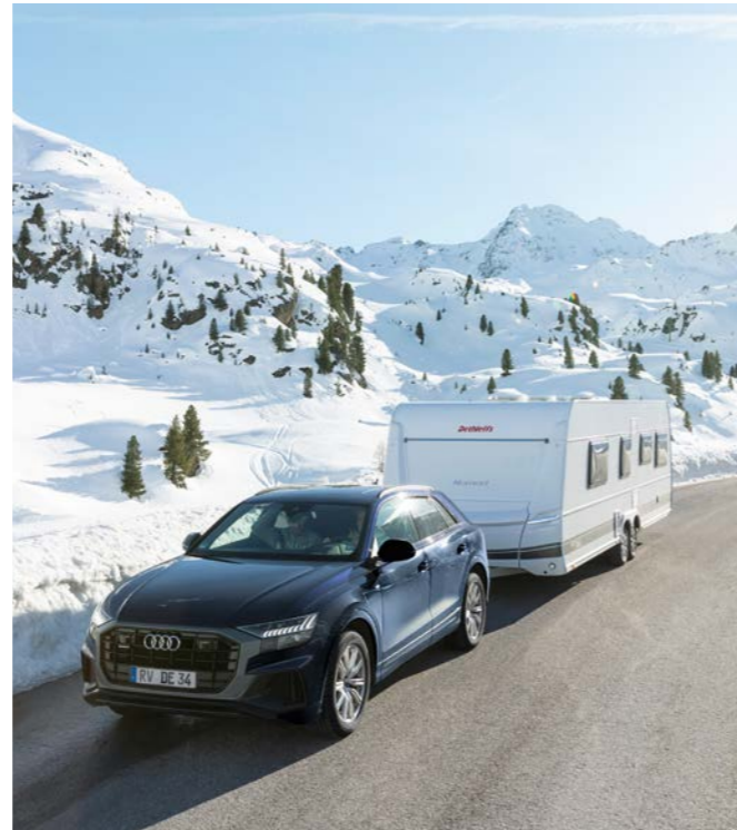
Veilig het koude jaargetijde door met een winterbestendige caravan met wintercomfortpakket van Dethleffs.