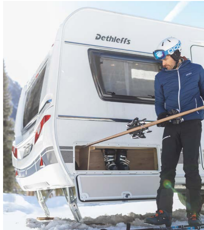
Een vakantiehuis vlak naast de skipiste, binnen net zo lekker warm als thuis.

Deze uitrusting, gebaseerd op jarenlange ervaring, houdt je caravan zelfs op bitterkoude nachten behaaglijk warm en voorkomt dat het watersysteem bevroert.