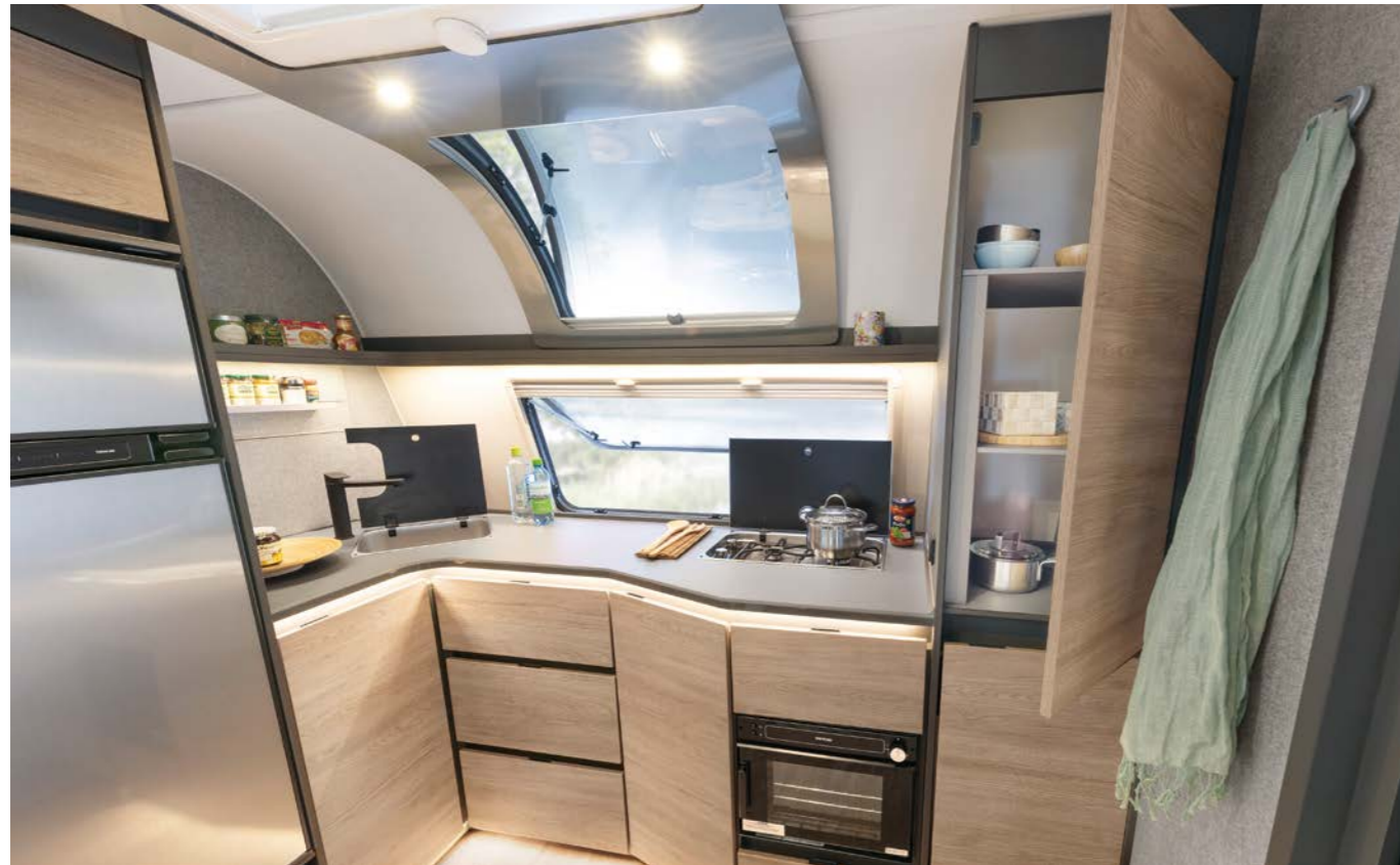
Bij de Beduin zijn de keukens gewoonweg fenomenaal! Uitrusting, werkvlak, opbergruimte, bewegingsvrijheid: beter kan niet. En het grote raamfront zorgt voor veel licht, frisse lucht en natuurlijk een prachtig uitzicht. • 690 BQT