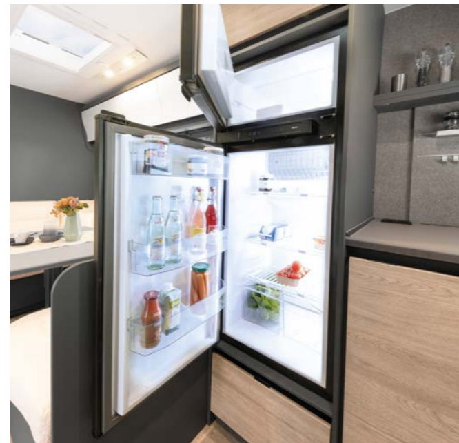
Hier blijft alles lekker koel. Koel-vriescombinatie met een totaal volume van 137 resp. 156 l (afhankelijk van het model) met automatische energiekeuze (AES).