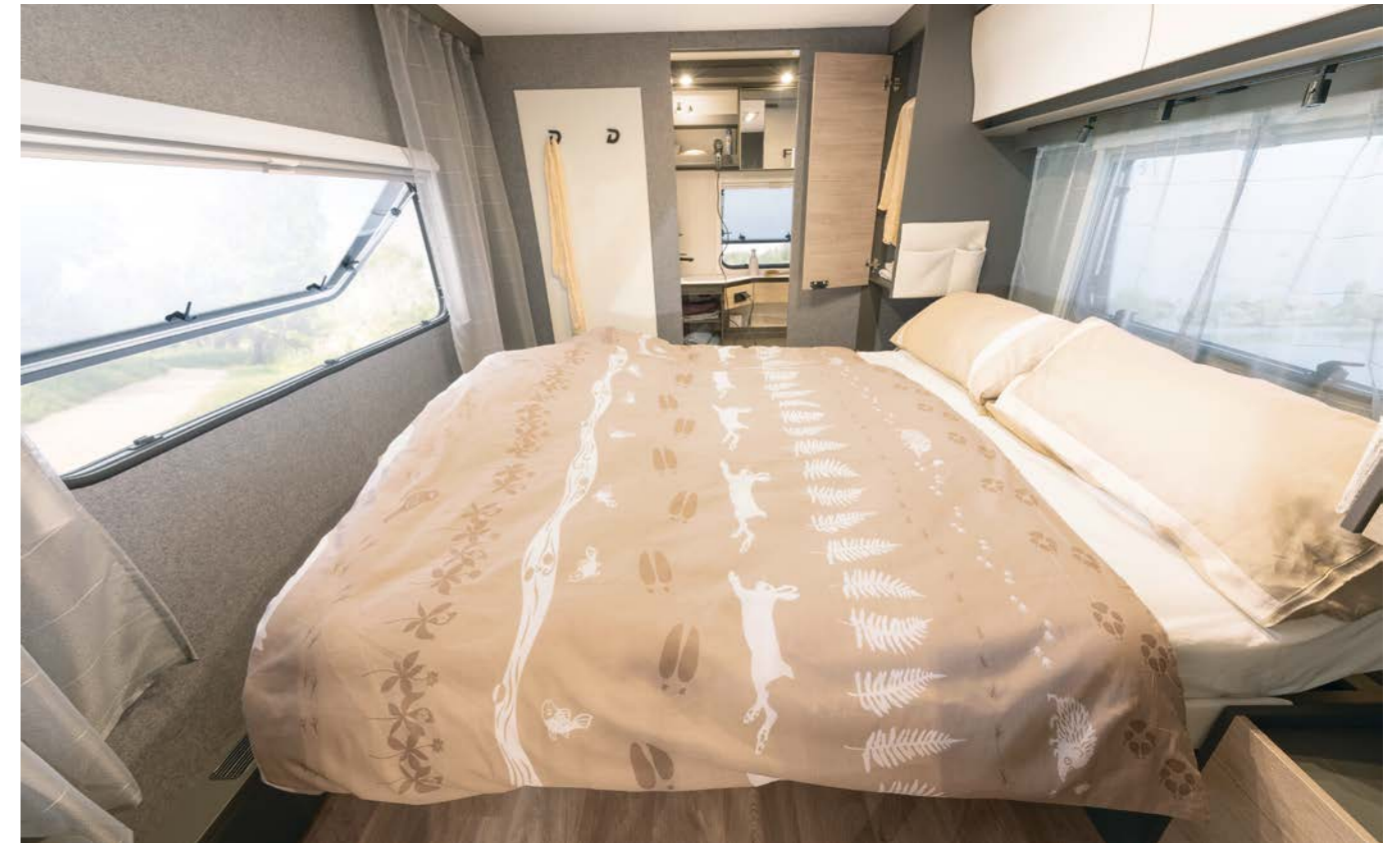
Het royale queensbed kan in de lengte worden verschoven, waardoor de badkamer overdag nog beter toegankelijk is. Daaronder zit een enorme opbergruimte verborgen die ook van buitenaf toegankelijk is. • 690 BQT