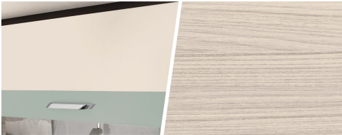
+ Tindari Bora