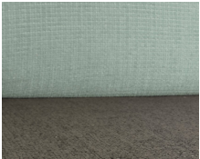
+ Bekleding Timor