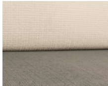
+ Bekleding Kapan