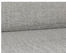
+ Bekleding Samir