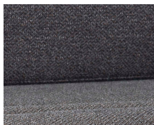
+ Bekleding Melia