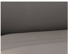
+ Echtlederen bekleding Collin ○