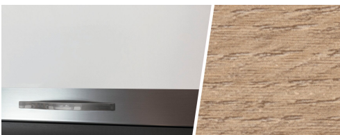
+ Meubeldecor Amberes Oak