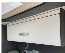
+ Meubeldecor Amberes Oak ○