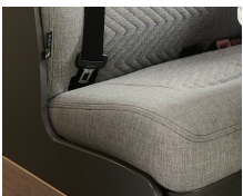
+ Bekleding Scandi