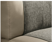
+ Bekleding Camino