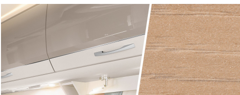
+ Mobilier décor : Noce Nagano