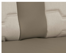
+ Ambiance intérieure : Nubia ○