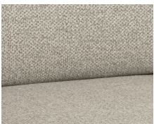
+ Ambiance intérieure : Kari