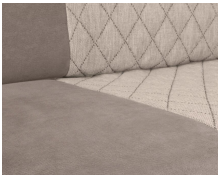
+ Tissu Jupiter