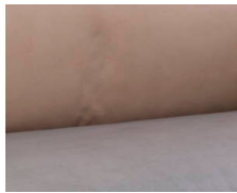
+ Ambiance intérieure : Duke